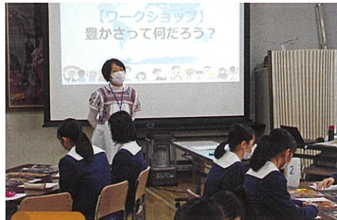
12月 国際理解セミナー (ワークショップ形式の講演会)