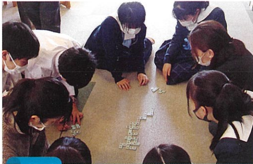
8月 イングリッシュキャンプ (県内のALTの先生と1泊2日で英語で活動)