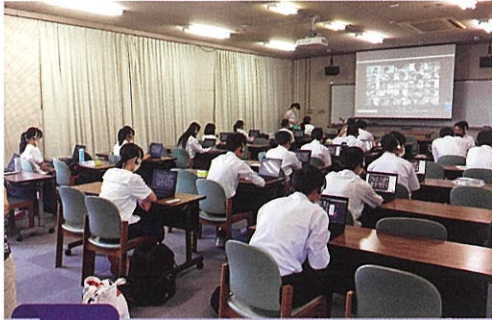
通年 サンディゴート高校とのオンライン交流 (ESS部、オンライン会議での定期的な交流)