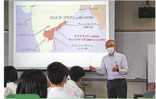
7月 国際理解のための講演会 (外交官や元青年海外協力隊の方などの講演会)