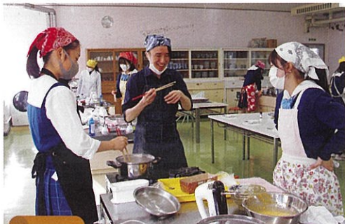
12月 食文化交流会 (ブラジルやベトナムなど世界の料理の調理実習と文化講演)