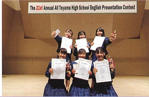
各種コンテストに挑戦