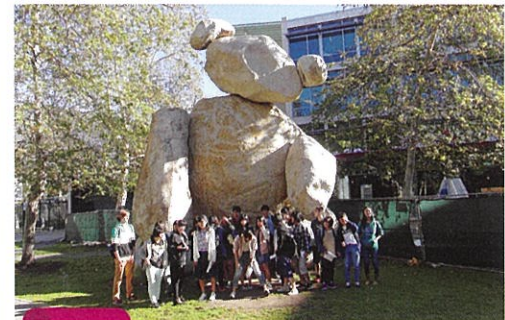
3月 海外研修 (R1~3は中止) (アメリカでのホームステイと高校生活体験)